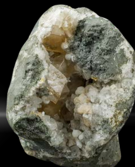
OKENIT KALCIT HEULANDIT BROHANTIT M #10400 3.000 din