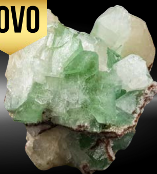
ZELENI APOFILIT STILBIT #10098 1.200 din