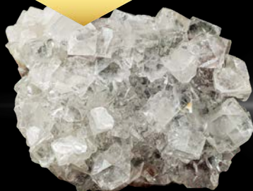
APOFILIT KALCEDON #10467 1.200 din