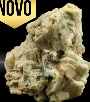
HEULANDIT #10469 1.000 din