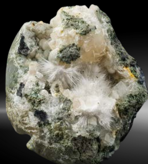
OKENIT KALCIT HEULANDIT BROHANTIT S #10401 1.000 din