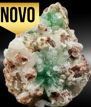
ZELENI APOFILIT STILBIT HEULANDIT MORDENIT #10455B224 1.300 din