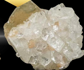
APOFILIT STILBIT KALCIT #10471 1.200 din