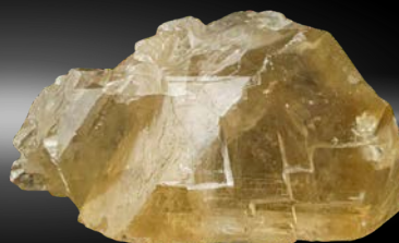
OPTIČKI KALCIT #10473 1.800 din