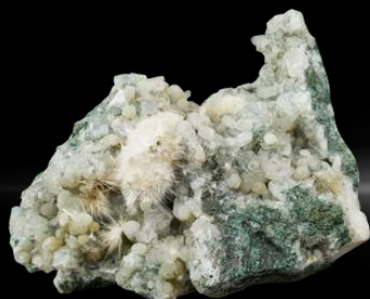
OKENIT KALCIT HEULANDIT BROHANTIT M #10400 3.500 din