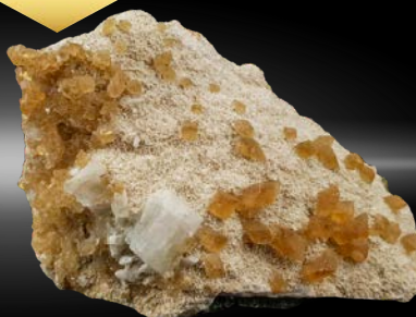
KALCIT NA MORDENITU #10461 2.000 din