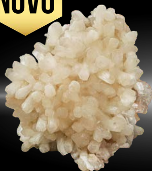
STILBIT HEULANDIT #10463 1.900 din