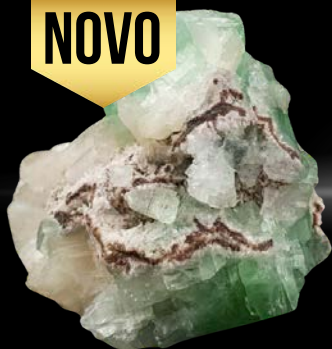
ZELENI APOFILIT STILBIT #10098 1.200 din