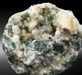
OKENIT KALCIT HEULANDIT BROHANTIT S #10401 2.000 din