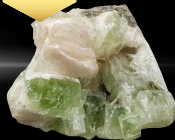
ZELENI APOFILIT STILBIT #10098 1.200 din