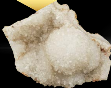
KVARC #10489 1.500 din